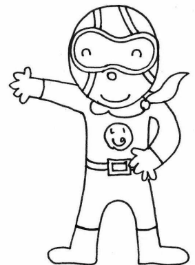
いのるンジャー ディボーションのチカラで世界に 平和をもたらすために戦っている