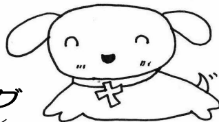
つうドッグ せいしよを通読(=はじめからさい ごまで読むこと)するのが大好き