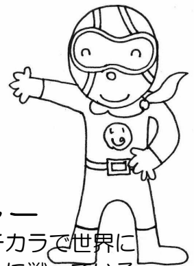
いのるンジャー ディボーションのチカラで世界に 平和をもたらすために戦っている